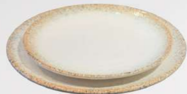
בונה זהב צלחת הגשה