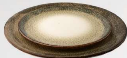
סנייק צלחת הגשה