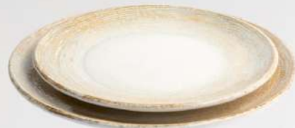
קדם צלחת הגשה