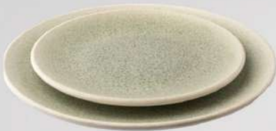
שמים צלחת הגשה