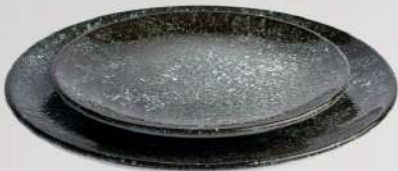
בלאק צלחת הגשה