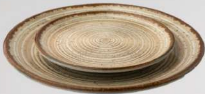
סהרה צלחת הגשה