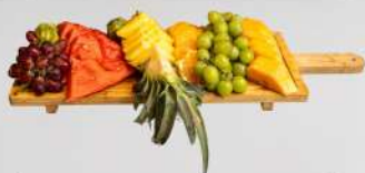
פלטת פירות העונה 16 ש"ח למנה