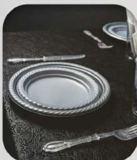
קלאסי 6 ש"ח