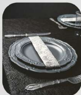
נאפולי 7 ש"ח