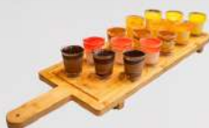
כוסות מוס 5 ש"ח למנה