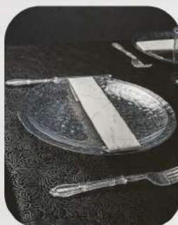
וינטג' 8 ש"ח