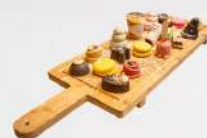
פטיפורים 7 ש"ח למנה